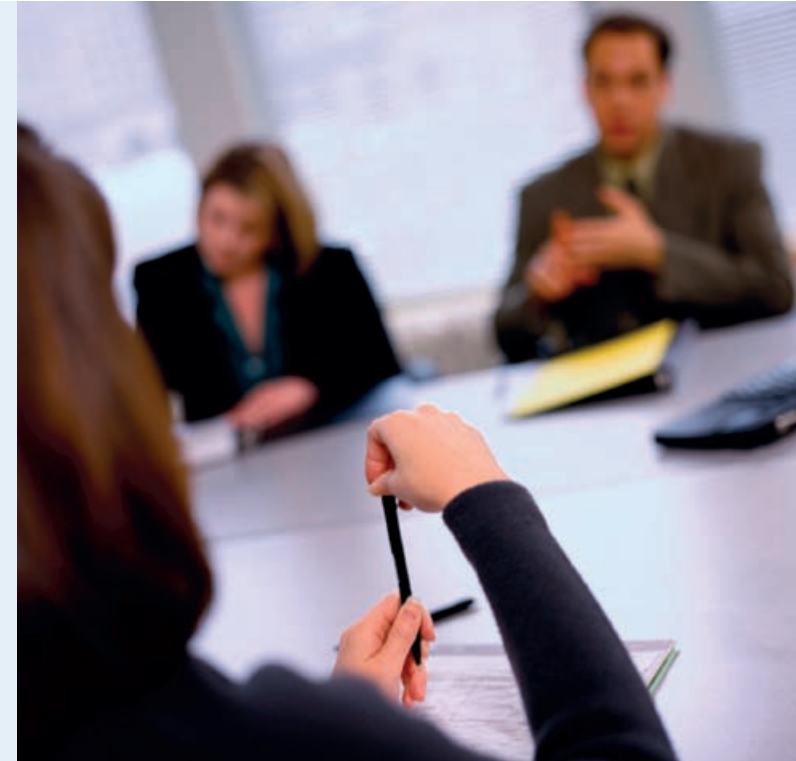
Visionen werden greifbar.

Hier können Sie Maschinen, Autos, Kunst, Mode oder Ihre neue Idee präsentieren. Mitten im Treiben und dennoch abgeschirmt schaffen wir Ihnen Raum für Vorträge und Referate.