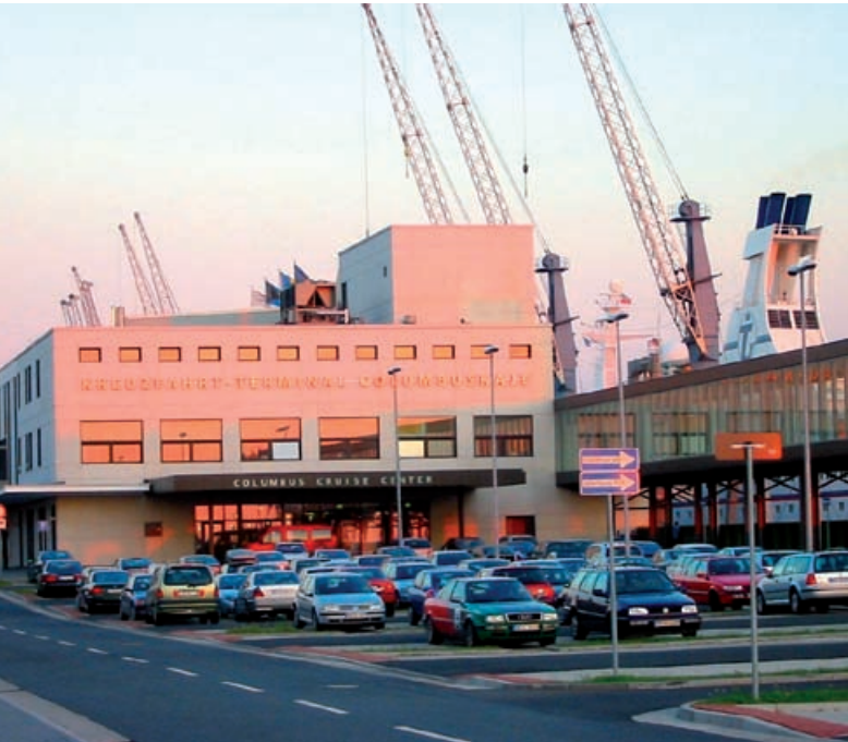
Ein seltener Luxus – ausreichend Parkplätze direkt vor der Tür.