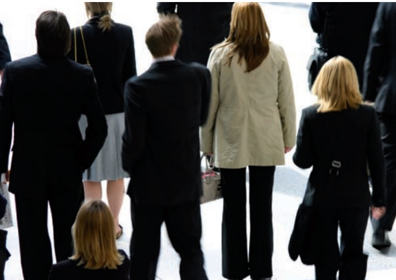
Eine frische Brise sorgt für einen klaren Kopf.